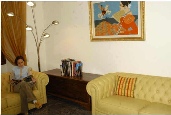
foto 1a Particolare dello studio

Ho sempre desiderato che il mio ambiente di lavoro esprimesse la sensazione di comfort, cura e, possibilmente, eleganza. L'hi-tech è confinato solo negli strumenti di lavoro. Spesso le sedute con i pazienti sono lunghe e ritengo importante che nei momenti di relax il paziente si senta a suo agio, come se fosse in casa propria o, quantomeno, in un buon albergo (foto 1).