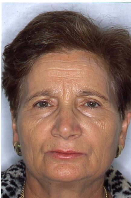
foto 5 Volto a tre anni dalla riabilitazione su impianti