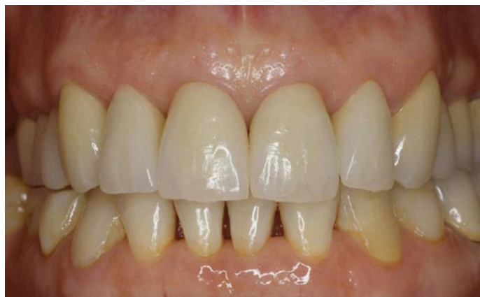
foto 3 Riabilitazione estetica su denti naturali. Situazione finale