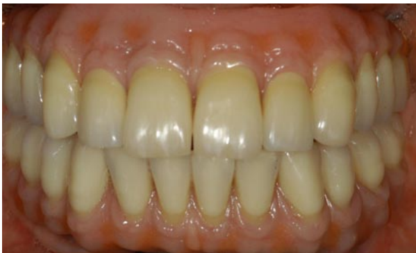
foto 7 Riabilitazione su impianti. Situazione post-operatoria