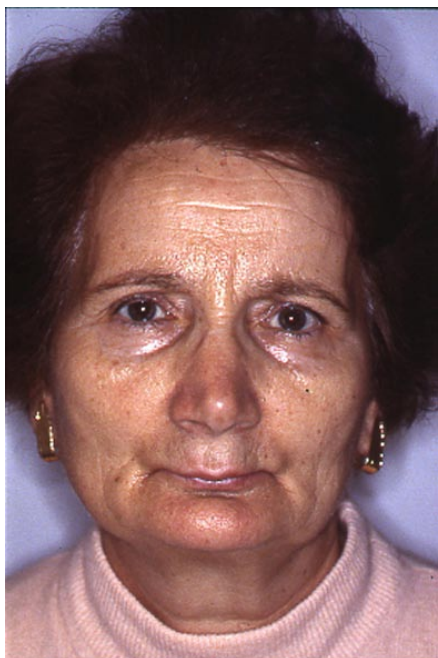
foto 4 Volto prima della riabilitazione su impianti

Nell'ambito di un grosso lavoro riabilitativo protesico, il dentista è in grado di cambiare numerosi parametri dell'estetica facciale. Un lavoro consapevole a livello dentale porterà ad un ringiovanimento dell'intero viso (foto 4, 5).