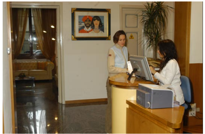
foto1b Particolare dello studio