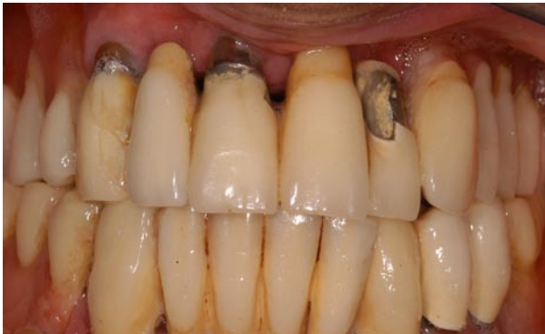
foto 6 Riabilitazione su impianti. Situazione iniziale

La riattivazione funzionale dei muscoli, come normalmente avviene nel soggetto sano, comporterà il normale trofismo: connotati ed espressività del volto riacquisteranno un aspetto assolutamente naturale (foto 6,7,8,9).