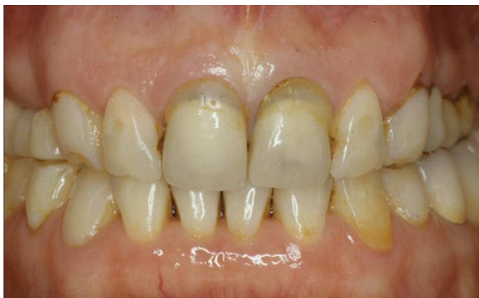
foto 2 Riabilitazione estetica su denti naturali. Situazione iniziale