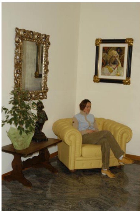
foto 1c Particolare dello studio